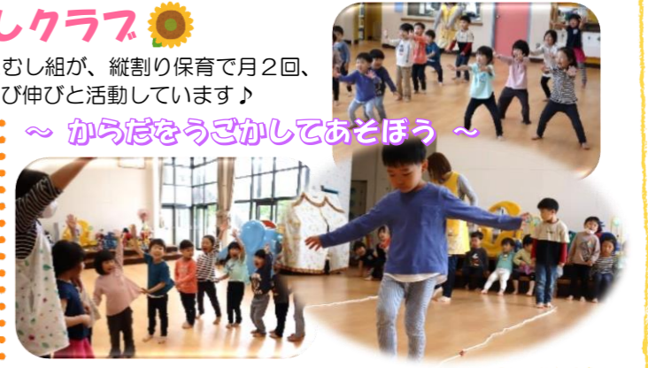
~からだをうごかしてあそぼう~