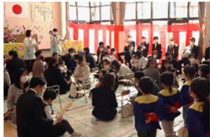
4/4 第43回目の入園式が開催され、新入園児12名・令和4年度途中入園児4名 計16名の新しいお友達を迎えました。ちょっと緊張気味のようにでしたが、お返事上手でしたね！