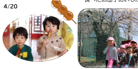
4/20 満開の桜、お天気も良く3~5歳児は尾花沢中学校までお散歩してお花見しました。みんなで食べたお団子おいしかったね！