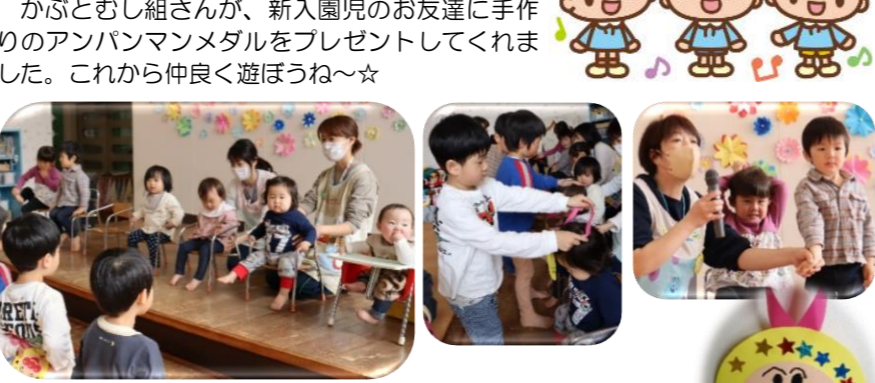
4/11 かぶとむし組さんが、新入園児のお友達に手作りのアンパンマンメダルをプレゼントしてくれました。これから仲良く遊ぼうね~☆