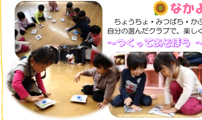
なかよしクラブ ちょうちょ・みつばち・かぶとむし組が、縦割りの保育で月2回、自分の選んだクラブで、楽しく伸び伸びと活動しています♪ ~つくってあそぼう~