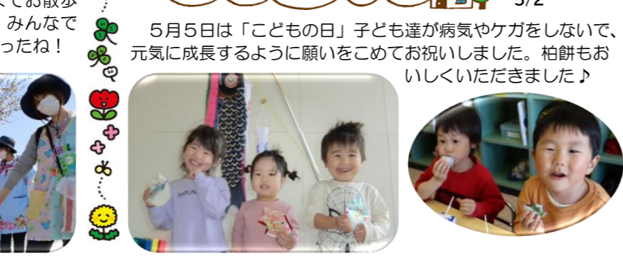
5/2 5月5日は「こどもの日」子ども達が病気やケガをしないで、元気に成長するように願いをこめてお祝いしました。柏餅もおいしくいただきました♪