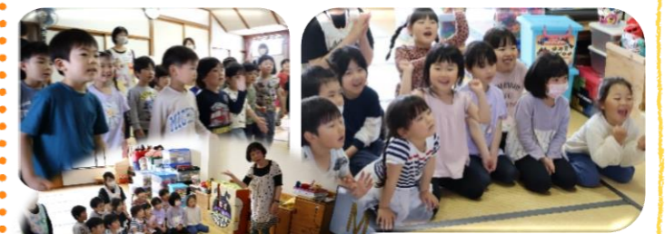
英語教室 みつばち・かぶとむし組が月2回、楽しく英語にふれています。