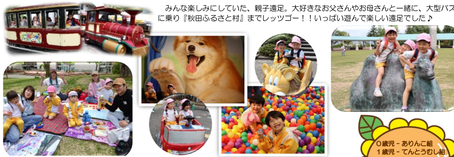
5/20 みんな楽しみにしていた、親子遠足。大好きなお父さんやお母さんと一緒に、大型バスに乗り『秋田ふるさと村』までレッツゴー！！いっぱい遊んで楽しい遠足でした♪